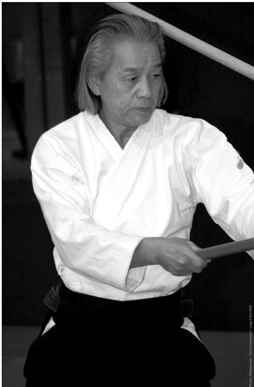
stage à Sète 2008.

Il fêtera ses 40 ans de présence en Europe en Juillet 2009, lors d'un stage d'été organisé en Suède avec tous ses élèves et les dojos qui le suivent dans sa démarche...