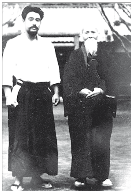
Tomita Sensei - O Sensei 1969