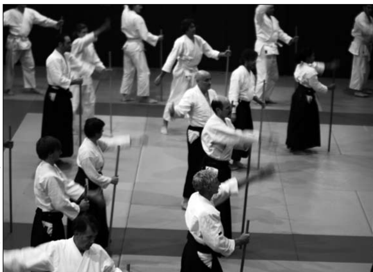
stage à Sèle, 2008.

De cette recherche personnelle et de ce travail pluridisciplinaire, est née