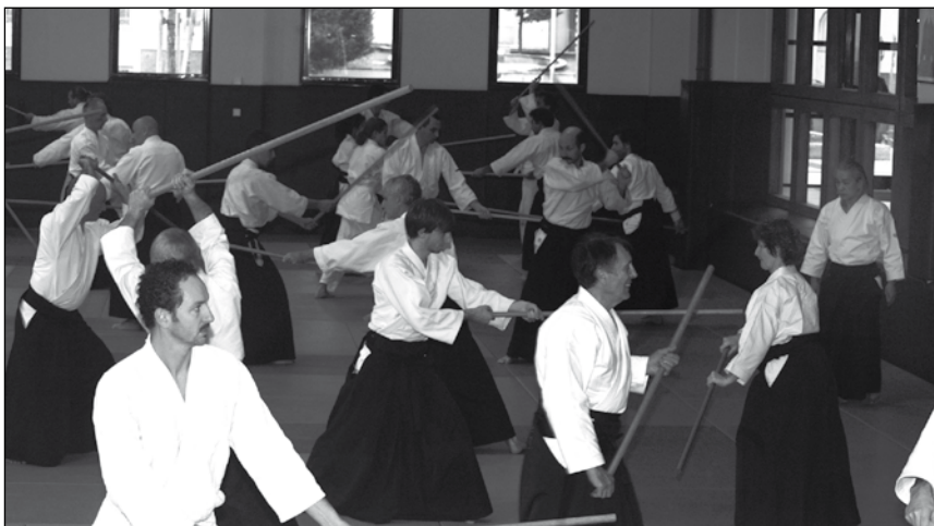
stage à Sète 2008.